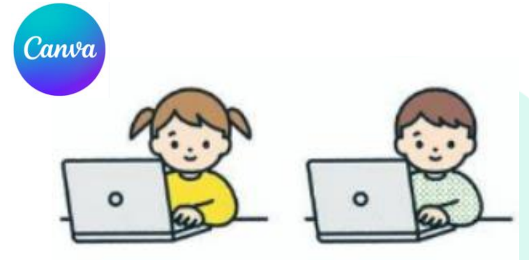
Canva 「Canva AI」