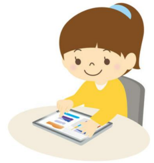
ミライシード「ドリルパーク」