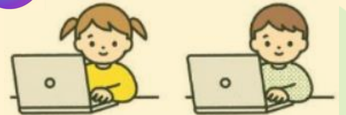
Canva 「Canva AI」