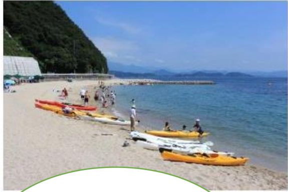
シーカヤック体験