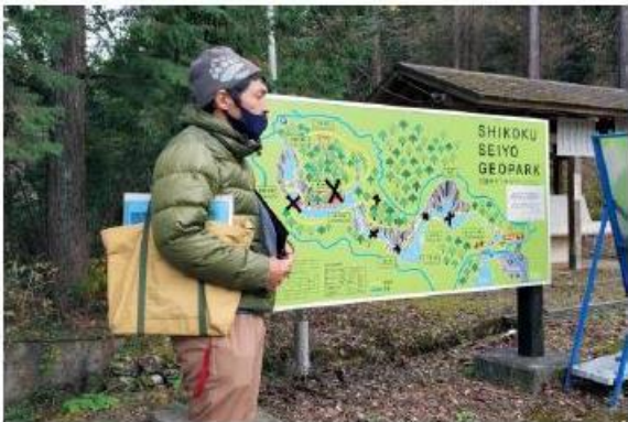
四国西予ジオガイド