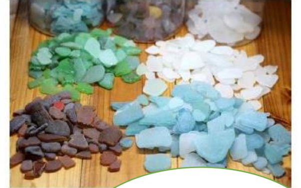
シーグラスのフォトフレーム作り