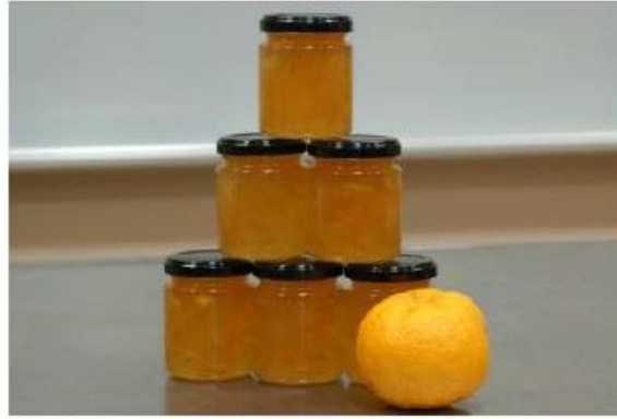
みかんジャム・マーメイド作り