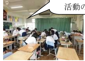
2年生の活動の様子