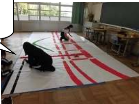
3年生の活動の様子

10月7日の文化祭に向けての取り組みが佳境を迎えています。約3週間の取組を経て、ここまでやってきました。成人式や同窓会の場でよく話題にあがるのが、体育祭と文化祭の話です。特に文化祭の話は盛り上がります。なぜなら文化祭の取組には、たくさんのドラマがあるからです。クラスがなかなかまとまらなかったり、演劇では声が出なかったり、時には文句も出たり…頑張りたい人は焦る気持ちも出てきたりと、必ずと言っていいほど壁が立ちはだかります。でも、話し合いや練習方法の工夫、委員さんのリーダーシップなどの力でこの壁を乗り越えていくんです。その中では「相手へのおもいやり」や「周りへの配慮の気持ち」という人として大切な感情が育っていきます。学校で文化祭に取り組む意義はこのようなところにもあるのではないのでしょうか。今年は緊急事態宣言の影響で、分散登校となり、準備の時間が短くなってしまいました。その分、限られた時間の中でよい作品を作ろうと、それぞれの学年が集中して準備に取り組めたと思います。当日はそれぞれの壁を乗り越え、一致団結したクラスや学年の様子が見られることを期待しています。