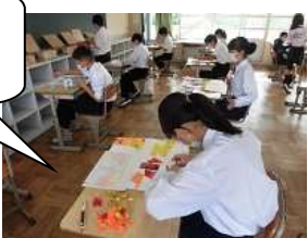
1年生の活動の様子