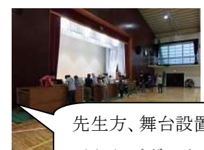
先生方、舞台設置ありがとうございます。

全体テーマ：「永(えい)劫(ごう)回(かい)帰(き) -今 この一瞬を『楽しもう』!! -」