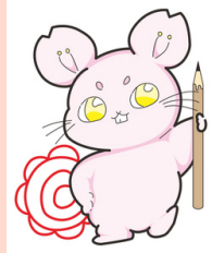
豊津西中学校 マスコットキャラ ニシチュー