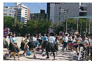
上-グラウンドよりの校舎全景 中左-「豊心」の碑 中右-3年男子 下左-50周年樹 下右-3年女子