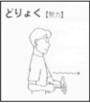
日本手話研究所・編 「日本語・手話辞典」より