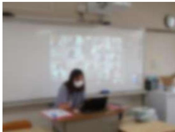
↑ 教室では、先生がこんな風に皆さんと繋がっていました。

今後も臨時休校になった時の備えとして端末を持ち帰っての課題提出の練習を行いますので、操作や接続に慣れるようにしてください。また、持ち帰り練習時に使った参考資料を順次五中 HP にアップしていきますので、操作や接続に困ったときはそちらも参考にしてください。