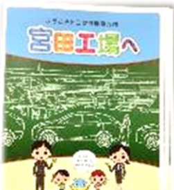
トヨタオンライン工場見学

先日非行防止・犯罪被害防止教室を実施しました。茨木少年サポートセンターの方に来ていただき「ルールを守ることの大切さ」や「スマホや SNS、オンラインゲーム」などの話をしていただきました。資料も配布していますので、ご家庭でもご覧ください。