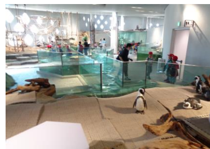
遠足に行きました（5月16日）