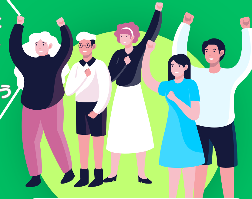
サポーター、保護者・地域