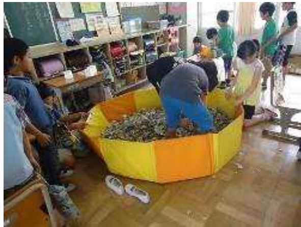
4年1組「いろいろゲームセンター」