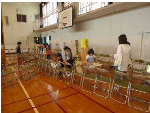
5年1組「スタンプラリークイズ」