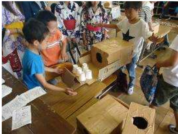
3年1組「プレミアムランド」