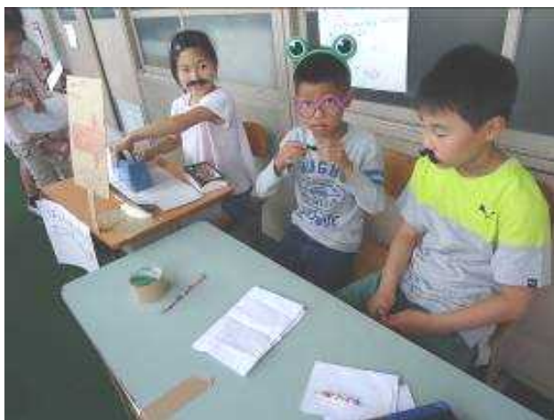
4年2組「はんにんさがし」