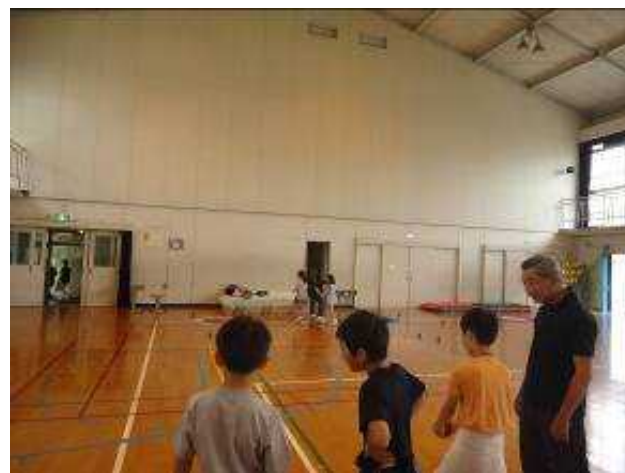
体育振興会「スプラッシュボール」