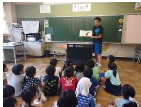
わくわくお話の会 7/11 (火)