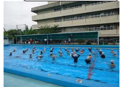
4年 授業公開 7/12(水)