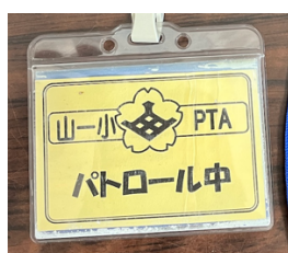
パトロールプレート側