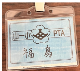
ネームプレート側