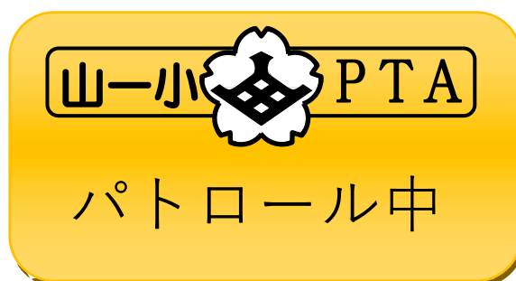
パトロールプレート