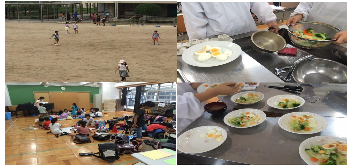
5年生 家庭科調理実習 「ゆで野菜」「ゆで卵」