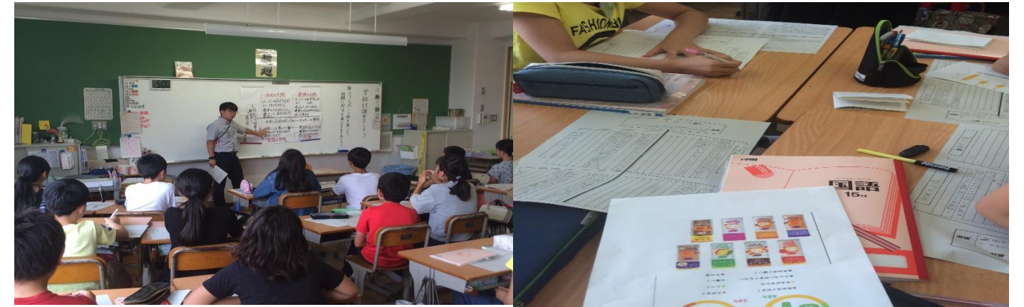
7月3日(水) 太陽の広場

6月28日(金)に6年2組で国語科の公開授業を行いました。テーマは「学級討論会をしよう」 自分の考えを整理してクラス内で伝え合う取り組みでした。本年度努力目標の1回目の授業でした。