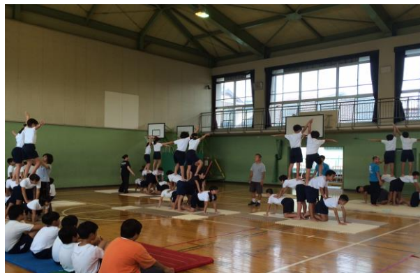
6年生 団体演技「組体操」の練習

6月に5年生が農業体験で植えたお米がすくすくと育っています。この間、地域の方々に管理していただいています。ありがとうございます。10月中旬に稲刈りを予定しています。運動会での「権六おどり」、2年生の「敬老会」での発表、地域教育協議会フェスティバルなど、地域とつながる「学び」やその成果の発表が多い二学期です。あらためて地域の皆様のご支援とご協力に感謝申し上げます。教室での日々の学習とともに、校外での行事や体験を通じて子どもたちがさらに大きく、逞しく成長してくれることを願ってやみません。