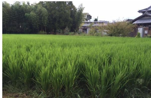
10月中旬の稲刈りが楽しみです