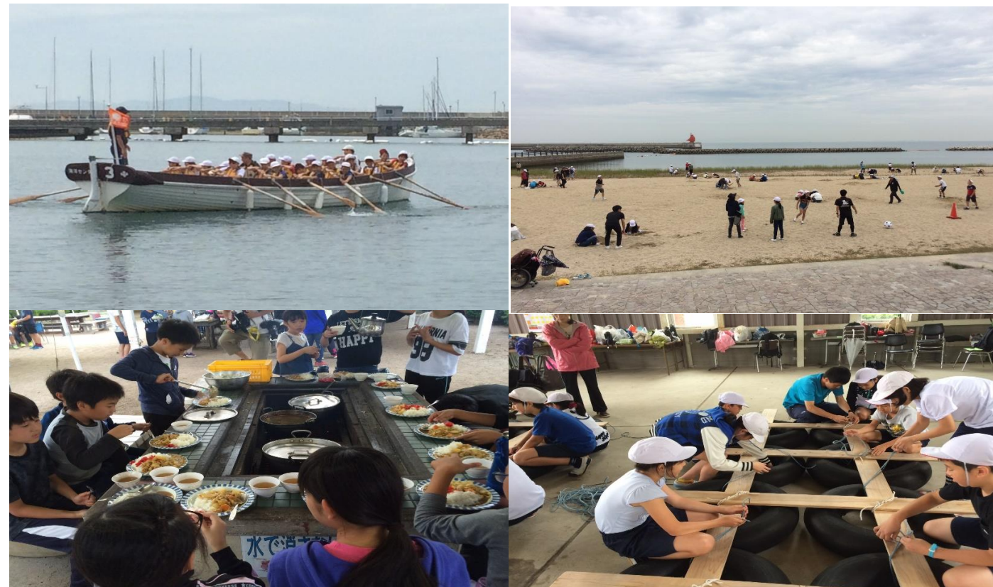
6月2日(土)にぎやかネット開講式

6年生が5月29日(火)・30日(水)の2日間、大阪府立青少年海洋センターで「海洋体験学習」をしました。2日目はあいにくのお天気でプログラムを変更しましたが、「思い出のおみやげ」をたくさんもって帰りました。