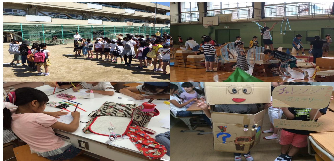
6月13日(水)山一カーニバル