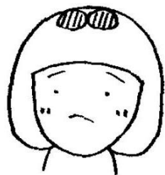
あたま 頭のとっぺん