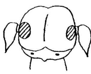
むす 結んだ髪のおねもと