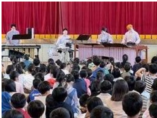
<5月12日(木) マリンバ演奏 Bumble Beat が来てくれたよ!>