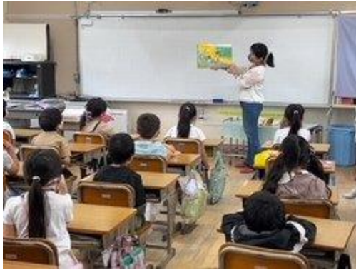
<5月6日(金) きしべ文庫の方が読み聞かせをしてくれたよ!>

地域の読書ボランティアさんです。1・2年生に 交互に読み聞かせに来てくれています。