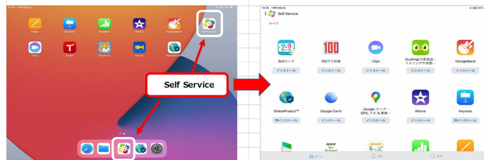
iPadホーム画面 (イメージ)