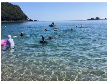
隊列を組んでの水泳