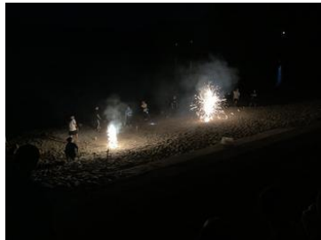
夜の集い 花火鑑賞