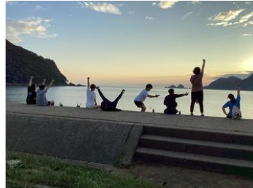
2日目もがんばるぞ!