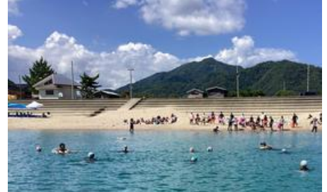
遠泳も泳ぎ着切りました!

♡♡掲載した写真は、千里新田小HP「せんしん日記 校長ブログ」からの引用です。活動の様子はぜひブログをご覧ください♡♡