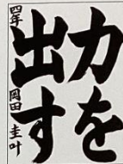
文部科学大臣賞 小学4年