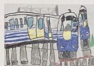
文部科学大臣賞 小学1年