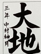
文部科学大臣賞 小学3年