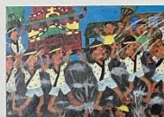
厚生労働大臣賞 小学4年