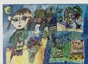
文部科学大臣賞 小学3年