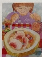
農林水産大臣賞 小学3年