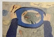
文部科学大臣賞 小学5年