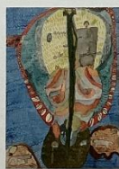
外務大臣賞 小学4年