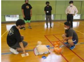
救命救助法及びAED活用