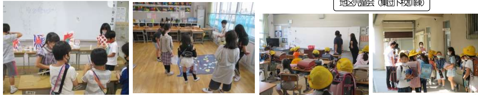
人権月間出前授業