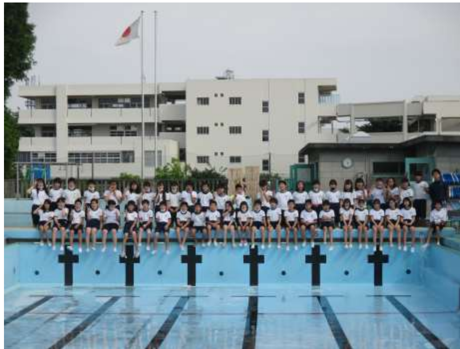
5月25日(火) 6年セです。プール清掃後、卒業アルバム用に集合写真を撮りました。