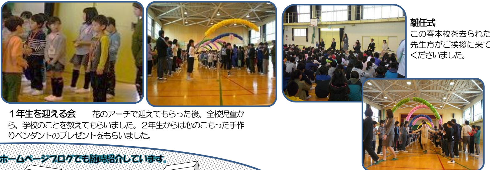
1年生を迎える会 花のアーチで迎えてもらった後、全校児童から、学校のことを教えてもらいました。2年生からは心のこもった手作りペンダントのプレゼントをもらいました。