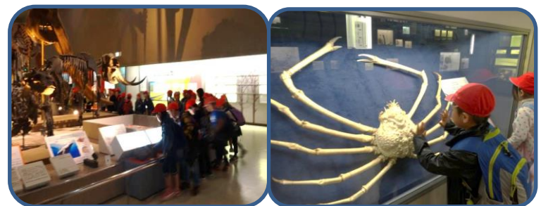
長居公園(3年) 大阪市立自然史博物館・長居植物園に行きました。大きな恐竜の骨に感動していました。植物園ではたくさん遊びました。