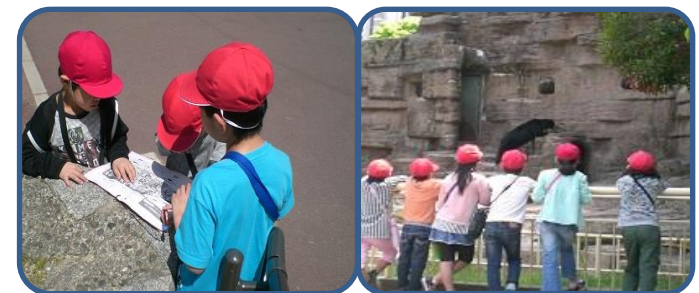
天王寺動物園(2年) 地図をもちグループで仲良く周り、たくさんの動物を見て楽しんでいました。