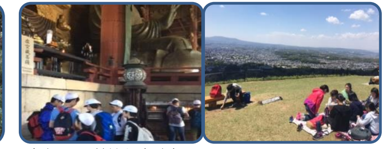
奈良公園・若草山(6年) 歴史学習を兼ねての遠足でした。大仏殿では大仏の大きさに感動していました。

子どもたちの様子は、本校ホームページ(子どもたちのブログ)で随時更新していきます。 本校ホームページも平成29年度版に更新していますので、ご覧ください。