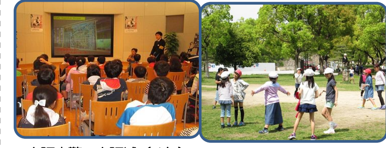
大阪府警・大阪城(4年) 大阪府警では、警察の仕事について話を聞きました。公園ではたくさん遊びました。