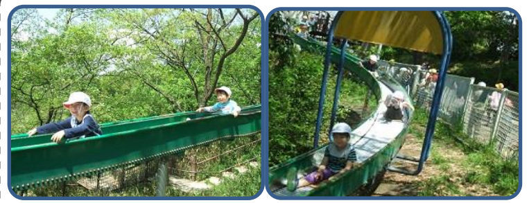
1年生 千里中央公園 とってもながいローラー滑り台を何回もすべったり、広い公園であそびました。