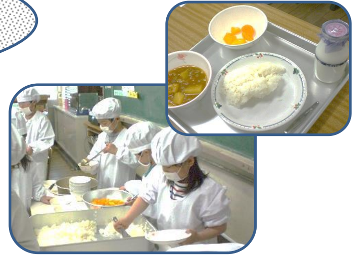
初めての給食です。(1年) 楽しみにしていた1年生の給食が始まりました。6年生がお手伝いに来てくれて、当番のやり方を教えてくれています。