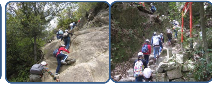
芦屋ロックガーデン(5年) なかなか難しい登り道が続きましたが、粘り強く最後までがんばって登りました。