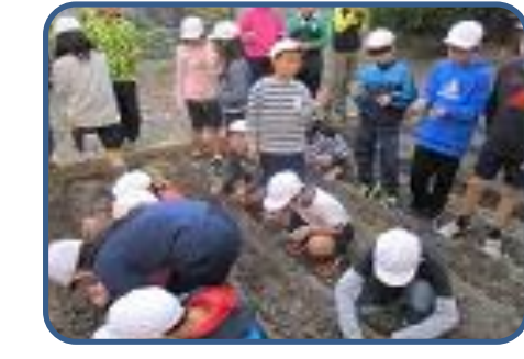
タマネギ植え(5年) イネを収穫した田んぼを畑に作り替え、タマネギを植えました。収穫は来年の春です。