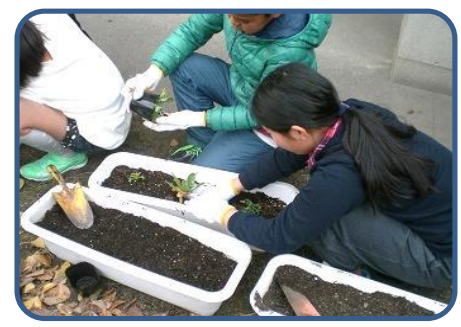
花いっぱいプロジェクト(4年) 10月に種まきした苗が育ってきたので、に地域の方々と一緒にプランターや花壇に植え替えました。春に花が咲くのが楽しみです。