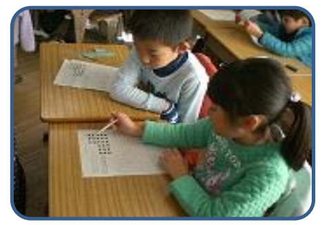
2年 算数研究授業 かけ算の学習の様子を校内の教職員で参観し、その後授業作りについて研修しました。