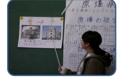
修学旅行報告会(6年) 修学旅行で学んだこと・平利について考えたこと等をまとめて、下学年の各教室に行き、分かりやすく伝えました。