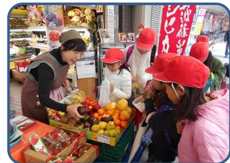
3年 旭通商店街見学 社会の学習で、旭通り商店街に見学に行き、300円の予算で買いもの体験をしました。