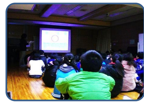
認知症サポーター養成講座(5年) 認知症とはどんな症状なのか、認知症の人に出会ったとき、どのように関わると良いのか(驚かせない・急がせない・プライドを傷つけないことが大切)を学び、認知症サポーターのオレンジリングをもらいました。