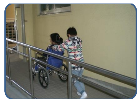
4年生 車いす・アイマスク体験 福祉委員会さんにお世話になり、実際に車いすに乗りたり押ししたりする体験やアイマスクをして支えもらいながら歩く体験をしました。