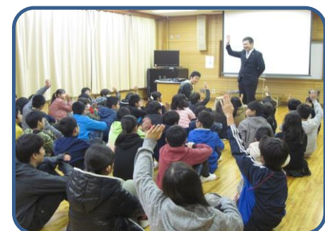
6年租税教室 税理士さんに来ていただき、税金の使い方や税金がないとどうなるかなど教えていただきました。