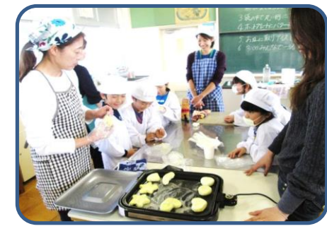
2年 親子行事 学年園で収穫したさつまいもをふかしてつぶしたものを、素敵な形にして焼いていただきました。保護者の皆さんにお世話になりました。