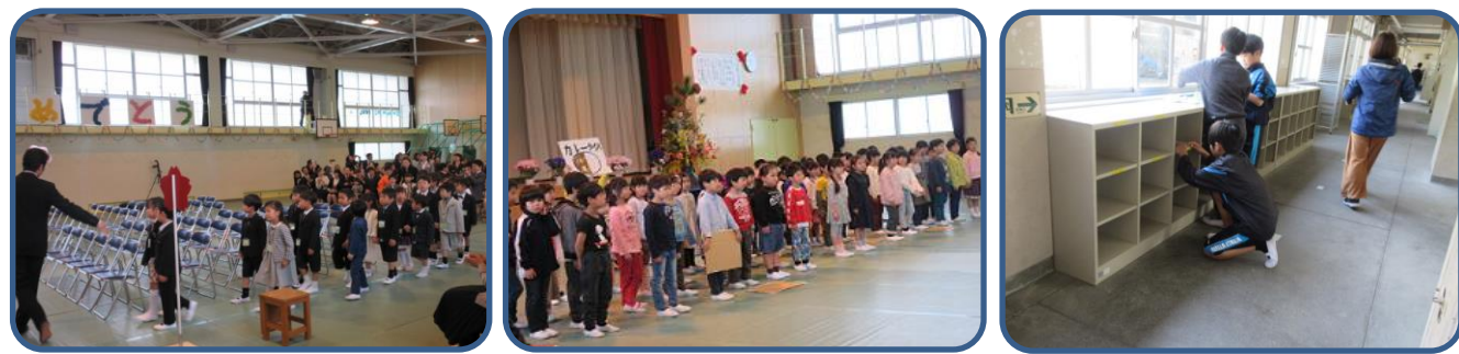
入学式 かわいい65名の1年生が入学してきました。6年生が前日より準備をしてくれました。当日は2年生が歓迎の言葉と歌を伝えてくれ、1年生の緊張もほぐれ、ニコリ笑顔でした。