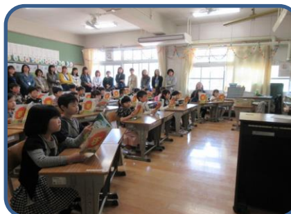
初めての参観(1年生) ちょっと緊張しながらもしっかり勉強している様子を見ていただくことができました。