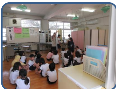
二測定 新しい学年になったので、どの学年も身長・体重を測りました。