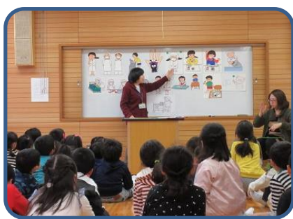
初めての給食 初めての給食の前に、南小栄養教諭さんに給食のお話をさせていただきました。初めての給食には優しい6年生の人たちがお手伝いに来てくれます。