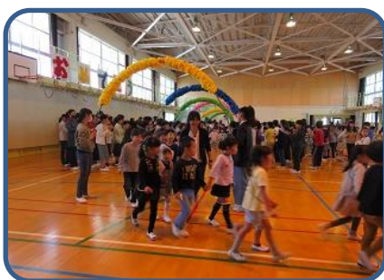
1年生を迎える会 2~6年生に温かく迎えられ嬉しそうにしていた1年生です。2年生からは、メダルのプレゼントをもらいました。