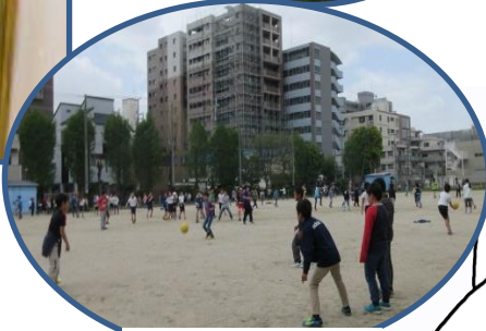
運動場ではたくさんの子どもたちが元気に遊んでいます。