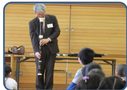
3年リコーダー学習 いろいろな種類のリコーダーの演奏やお話を夢中で聞いていました。