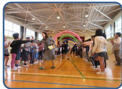
離任式 この春、本校を去られた先生方がお別れの挨拶に来ていただきました。