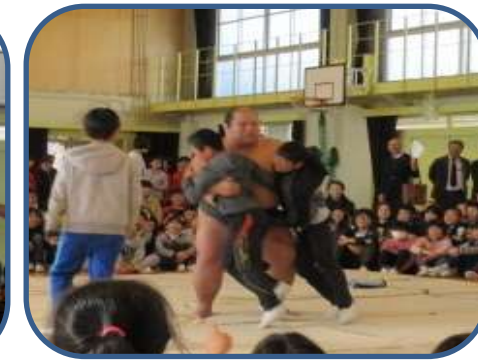
1年生は、子ども10人対力士さん一人、高学年は2人対力士さん一人対戦・盛り上がりました。