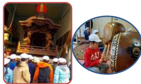
だんじり見学(3年) 社会の学習で金田町にあるだんじりを見学にいかせていただきました。