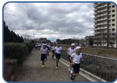
マラソン大会 5・6年生は糸田川の堤防を、1~4年生は校内を走りました。たくさんの保護者の皆さまが応援してくださいました。ありがとうございました。