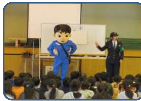
防犯教室(1・2年) おまわりさんから誘拐されないために気を付けることを教えていただきました。