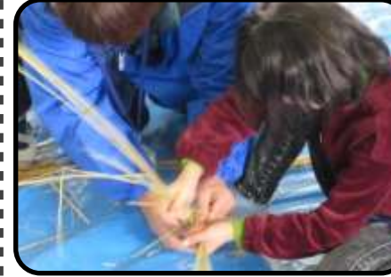
3年生 縄ない・七輪体験 昔の暮らしの学習で、藁をつかって「縄ない」と七輪での餅焼き体験をしました。