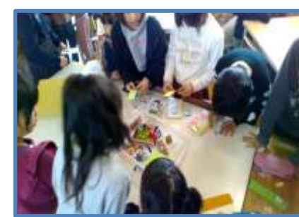
しおりづくり 休み時間に絵本カバーを活用したしおりをつくりました。