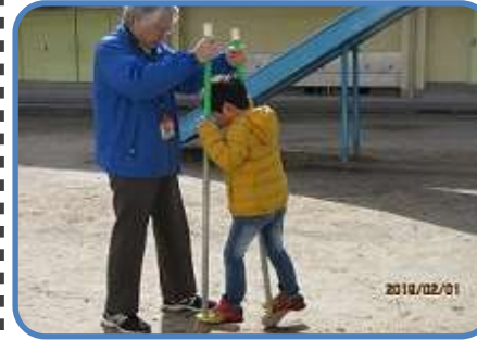
1年生 昔遊び 残念ながら1年2組は学級閉鎖のためできませんでした。昔遊び(コマ回し・竹馬・たけとんぼ・お手玉・はねつき)をおしえていただきました。