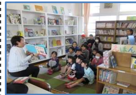
お話し会 休み時間の図書室で読み聞かせにたくさん集まってくれました。

2/25~2/28 まで読書週間として、お話レストランやしおりづくり、お話し会などの取り組みをしました。