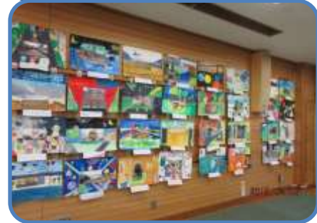
校内図工展 1日公開に合わせて実施。各学年の力作がそろいました