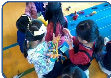
あそびパーク(学校見学会1年生) 1年生が、遊びコーナーを準備し、4月から1年生になる園児たちをお招きしました。優しく親切に関わる頼もしい1年生の姿を見ることができました。