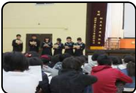
六中生徒会説明(6年) 4月から中学生になる6年生が、南小6年生と一緒に六中で、クラブや生徒会の話を書きました。