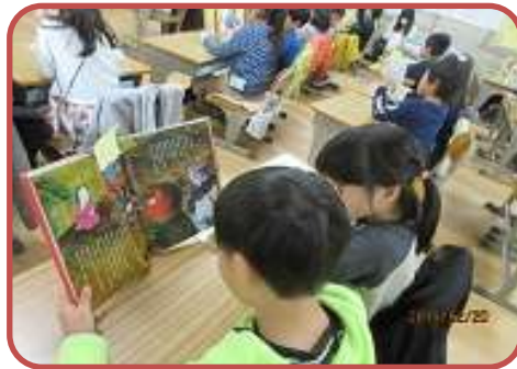
研究授業(1年) 国語の学習で自分の選んだ本の好きなの理由を友達に伝えました。