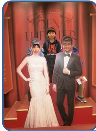
大阪イングリッシュユビレッシ (6年) エキスポシティにある英語体験施設にいき、シミュレーションゲーム等を楽しみました。