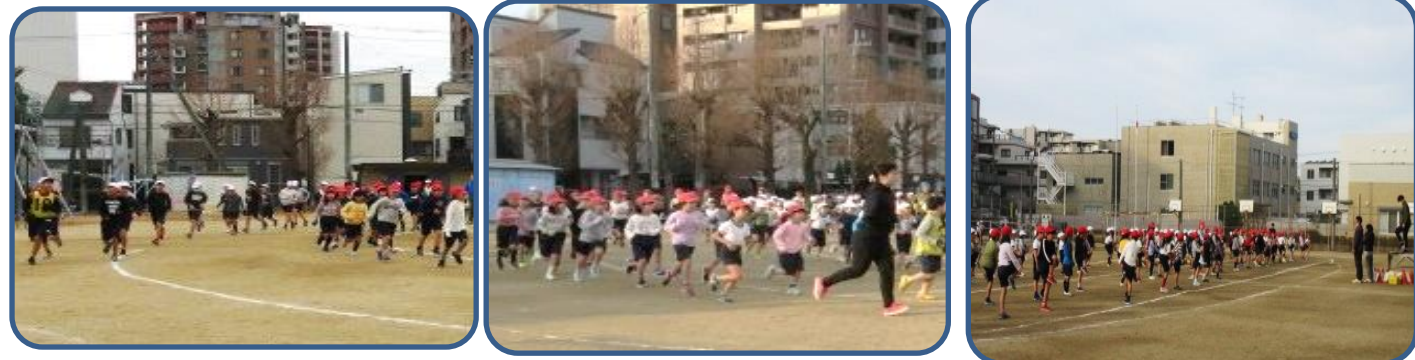
朝体育 1月の朝体育は、マラソンです。火・木曜日の朝、10分程度走ります。寒さに負けないで、自分のペースで最後まで走ることを目標に頑張っています。1～4年生は、一日公開でマラソン大会をします。5・6年生は、2月4日(月)糸田川堤防でマラソン大会をします。