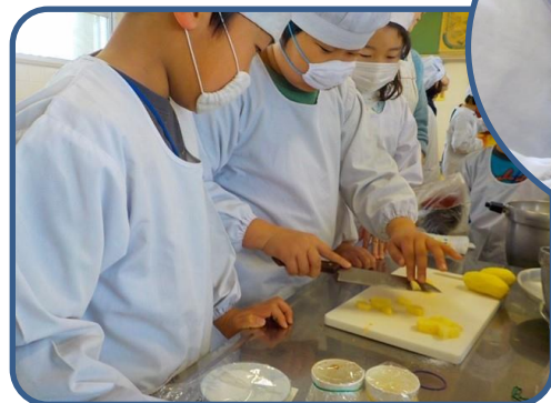
3年親子行事 保護者の方にお世話していただき、野菜を切って、すいとんをこねて、すいとんづくりをしました。「おいしい!!」と大喜びの子どもたちでした。