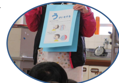
保健指導 二測定に合わせて、各学年保健学習をしました。1・2年生は風邪予防について、3・4年生は、咳エチケットについて、5年生はくすりについて、6年生は薬物について学習しました。