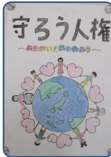
人権ポスター 2学期末学校だよりで紹介した吹田市人権きょういく作品展で佳作に入賞した作品です。