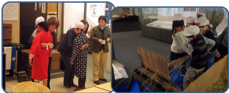
3年生 博物館見学 社会科の昔の暮らしの学習で、吹田市博物館に行きました。実際に昔の着物を着せていただいたり、火おこしをしたりとたくさん体験を通して学びました。