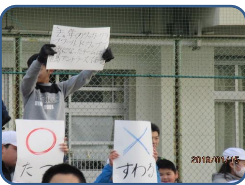
児童集会 1月の児童集会は体育委員会からのスポーツに関するO×クイズでした。「日本のオリンピックメダル第一号は、『テニス』である。Oか×か」などのO×問題にみんな参加しました。