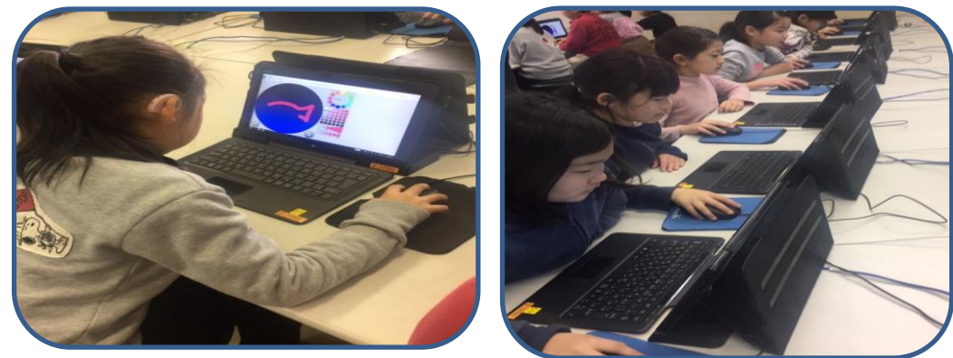
プログラミング学習 平成32年度から始まる新学習指導要領で新しく入る「プログラミング学習」に3学期は各学年取り組んでいます。これは3年生の授業の様子です。