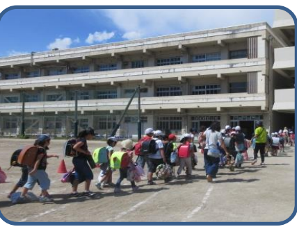
集団下校訓練 保護者・地域の皆様にもお世話になり校外班ごと集団下校をしました。