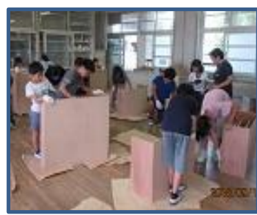
手作り本棚 校務員さんが作ってくださった学級文庫の棚に読書クラブの子どもたちがペンキを塗り、手作り本棚が完成しました。