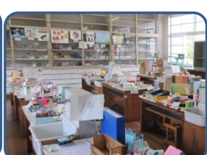
夏休み作品展 今年も、力作がたくさん並びました。それぞれ苦勞しながら取り組んだことでしょう。保護者の方もたくさん見に来てくださいました。