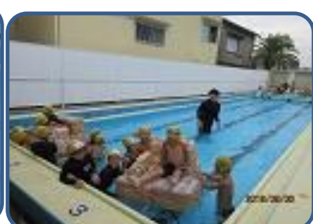
ペットボトルいかだ (1・2年) 2年生は1年生のために、たくさんのペットボトルを使っていかだを作りました。1年生がのりやすいように、うまく浮くようにと班で様々な工夫をしていました。