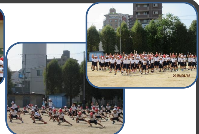
3・4年 (吹二丸) しっかり腰を落として踊る、力強いカッコいいソーランを乞うご期待！