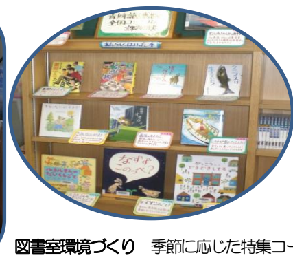
図書室環境づくり 季節に応じた特集コーナー・掲示物を作っています。