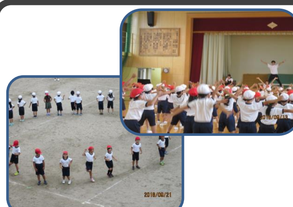
1・2年 (レッツ☆タッタ!) 身体を大きく動かして踊ります。とっても楽しそうに踊る笑顔に注目！