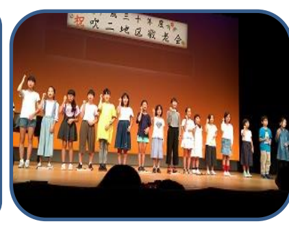
敬老会 (音楽・手話クラブ) メイシアターで開催された敬老会に、音楽クラブ・手話クラブ児童が出演しました。