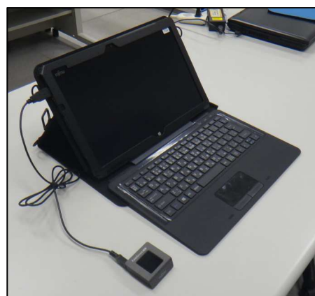
着脱式(デタッチャブル)ノートPC(教職員用)

また、付属のアクティブペン(スタイラスペン)を使えば、小さい文字や細かい線を描くことも可能です。タブレットカバーやストラップも付属しているので、落下等による破損を防止します。その他にも、職員室やコンピュータ教室に充電機能がある保管庫を設置し、防犯面や利便性の向上を目指します。