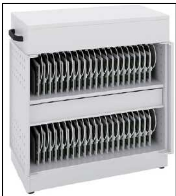
保管庫(コンピュータ教室用)

今回は、職員室やコンピュータ教室に配備する着脱式(デタッチャブル)ノートPCを紹介します。このPCの特徴は、液晶部分とキーボード部分が分離することです。教職員の場合は、職員室ではノートPCとして活用できるため、教材作成や成績処理等ができます。普通教室ではタブレットとして活用できるため、職員室で作成した教材提示が容易になります。一方、児童・生徒の場合は、コンピュータ教室ではノートPCとして活用できるため、資料や作品を作成できます。普通教室ではタブレットとして活用できるため、コンピュータ教室で作成した資料や作品を提示しながらプレゼンテーションが容易になります。