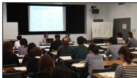
5/28「ちょこプリ」活用研修の様子