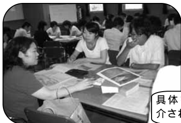
具体を持ち寄り紹介されました。

同学年のグループで実践をたくさん聞くことができ是非やってみたいと思うものがたくさんあった。